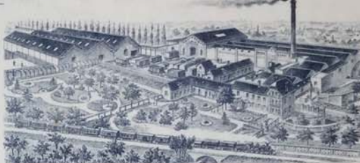
BLANCHISSERIE DE BERNOUVILLE (EURE)