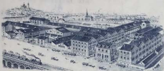
ETABL IS DE PARIS, 19, RUE LÉON GIRAUD